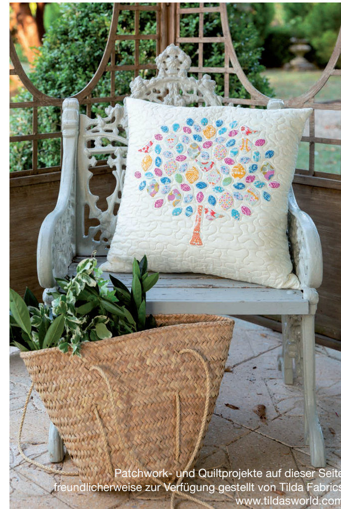
Patchwork- und Quiltprojekte auf dieser Seite freundlicherweise zur Verfügung gestellt von Tilda Fabrics www.tildasworld.com

Mit ihren vielen Funktionen der Extraklasse, hoher Nähgeschwindigkeit und einer Auswahl von 350 Stichen bietet Ihnen die eXcellence 780+ eine eindrucksvolle Nähleistung, inklusive 3MB Speicherkapazität. Konstruiert mit einem Metallrahmen, der große Stabilität bietet, können Sie mit dieser Maschine über Stunden mit der gleichen präzisen Stichqualität nähen.