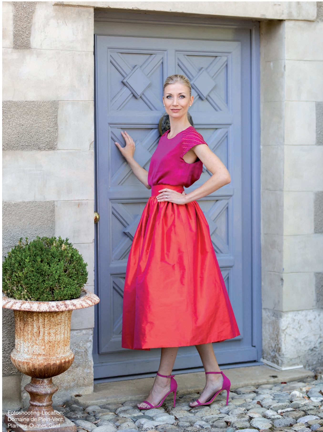
Fotoshooting-Location: Domaine de Plein-Vent, Plan-les-Ouates/Genf