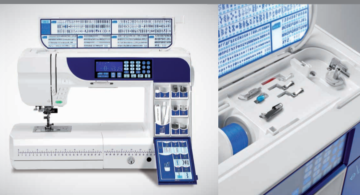
Standardzubehör eXcellence 730PRO

In drei Zubehörfächern, einschließlich dem elna-exklusiven Seitenfach, können Sie das umfangreiche mitgelieferte Zubehör mit zahlreichen Nähfüßchen übersichtlich verstauen.