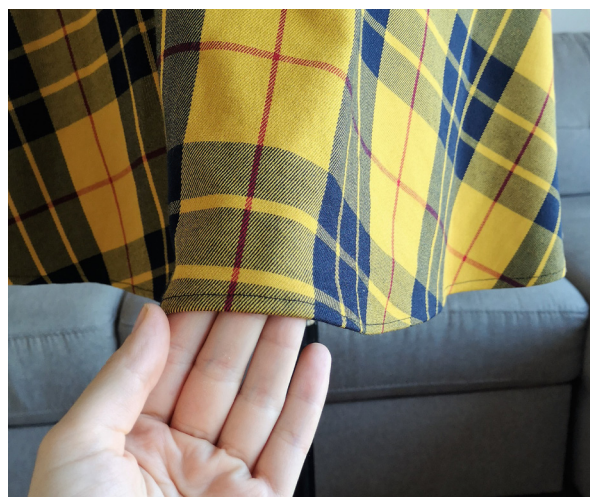
Ourlet sur l'endroit du tissu.

5. Repassez soigneusement l'ourlet et vous avez terminé !