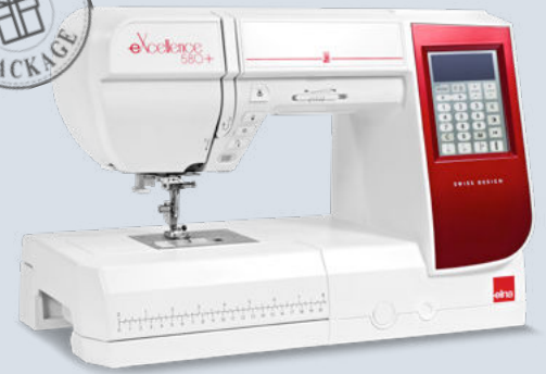
eXcellence 580+ Fashion & Decor edition

With an exclusive accessory bonus package!